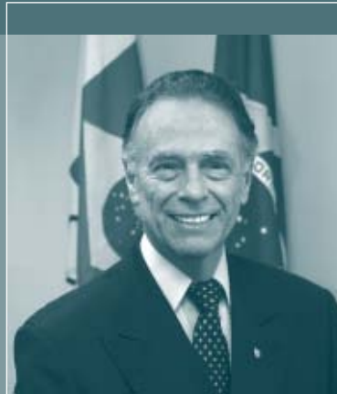
Carlos Arthur Nuzman